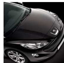
Stickers MyRCZ n°3