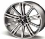
Llantas de aleación de 18" ORIGINAL FULL PIRIT GREY