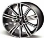
Llantas de aleación de 18" ORIGINAL DARK GREY