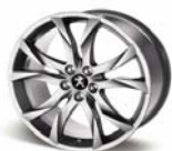
Llantas de aleación de 19" SORTILEGE