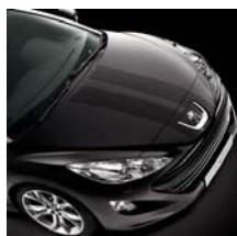
Stickers MyRCZ n°2