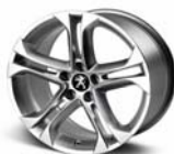
Llantas de aleación de 19" SOLSTICE ANTHRA GREY