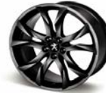
Llantas de aleación de 19" SORTILÈGE MAT BLACK ONYX