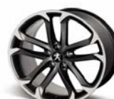
Llantas de aleación de 19" SOLSTICE MAT BLACK ONYX