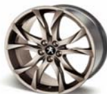
Llantas de aleación de 19" SORTILÈGE MIDNIGHT SILVER