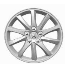
Llantas aleación 16" Style 01