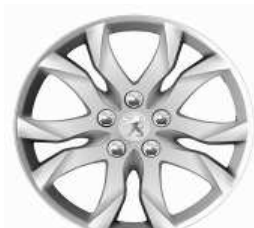
Llantas aleación 17" Style 05