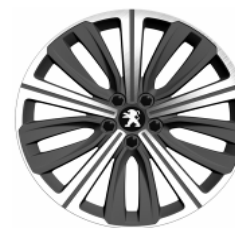
Llantas aleación 19" Style 12