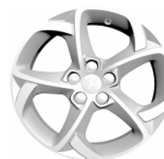
Llantas aleación 17" Style 09