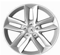
Llantas aleación 17" Style 04