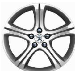
Llantas aleación 18" Style 10