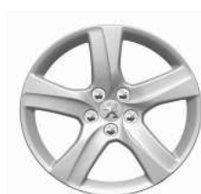
Llantas aleación 16" Style 02 (Business Line)