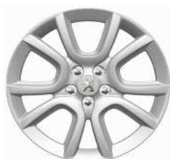
Llantas aleación 18" Style 07