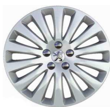
Embellecedores 16" Style A