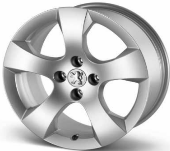
Llantas aleación 17" Savara