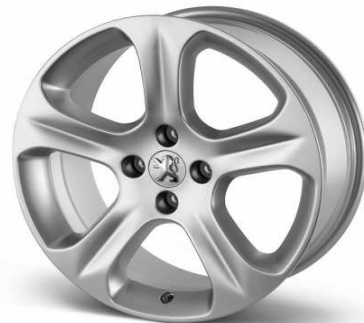
Llantas aleación 18" Exona