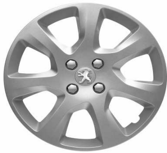
Embellecedores 17" Atax