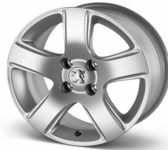
Llantas aleación 16" Isara