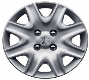
Embellecedor 15" Brisbane