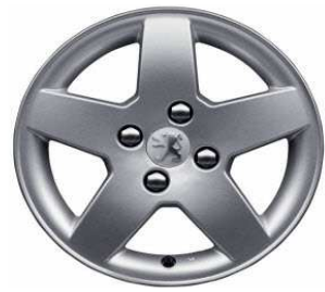
Llantas aluminio 15" Monaco