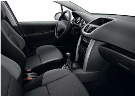
Guarnecido Negro Mistral Chilico