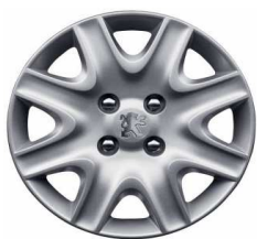
Embellecedor 15" Brisbane