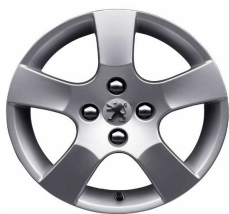
Llantas aluminio 16" Canberra