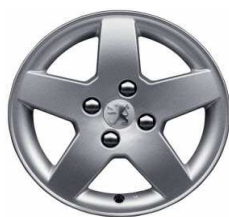
Llantas aluminio 15" Monaco