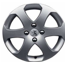
Llantas aluminio 16" Outdoor